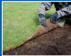
Reemplazo de césped