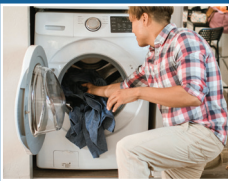
Electrodomésticos de bajo consumo de agua