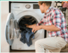
Electrodomésticos de bajo consumo de agua