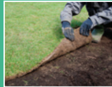
Reemplazo de césped