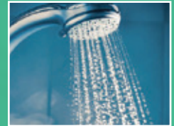
Sistema de recirculación de agua caliente